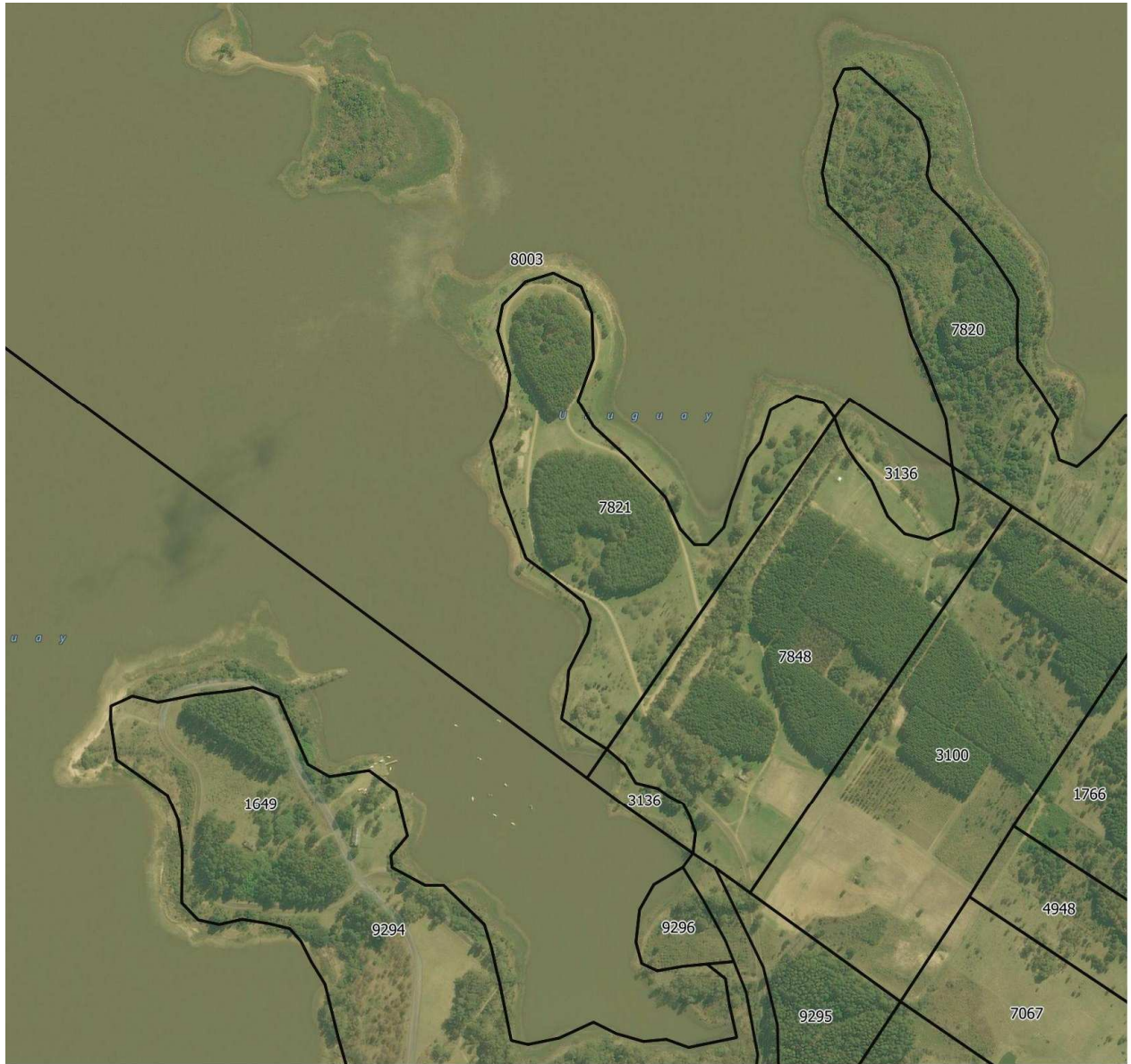
Fuente de información: Padrones rurales y urbanos del Departamento de Salto disponible en https://catalogodatos.gub.uy/dataset/shapes-del-parcelario-rural-y-urbano