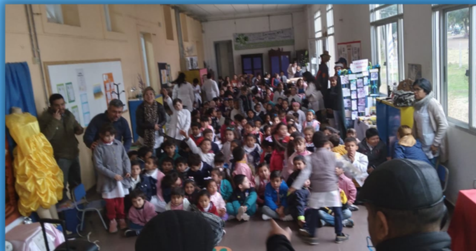
Escuela 6 de Belén. La materia y su transformación