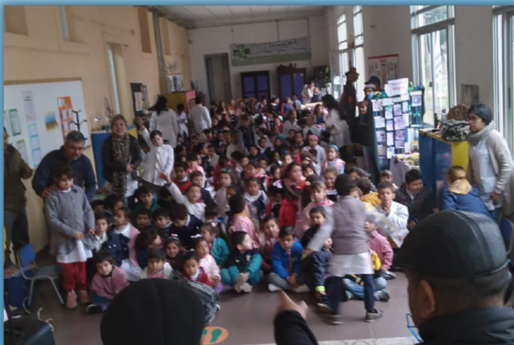
El Piñeyro en Escuela Nro. 6 de Belén.

Pasquin del Espacio Cultural Eduardo Piñeyro.