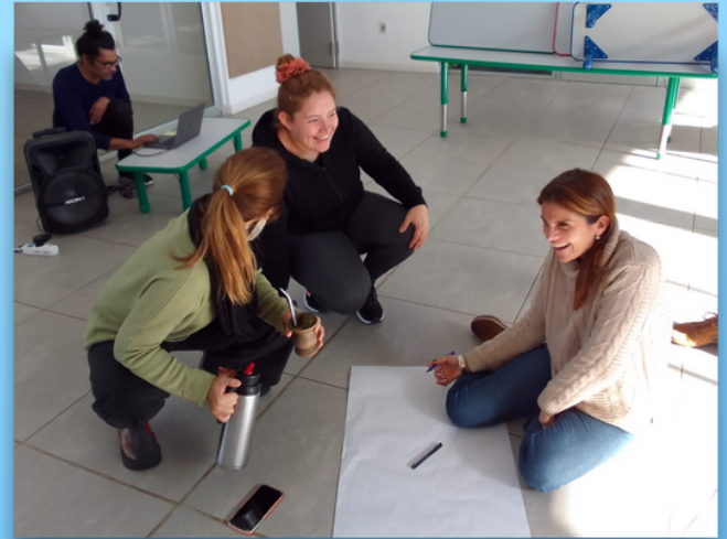
El trabajo en equipos. La creación con los otros.