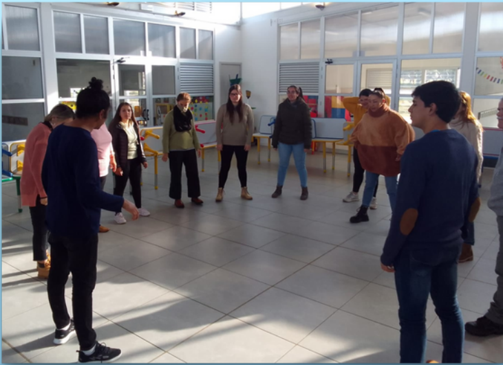
Preparar el cuerpo para trabajar